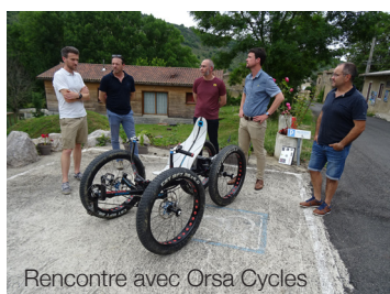
Rencontre avec Orsa Cycles

Calzan ne disposant plus de commerce, un vendeur ambulancier fait une halte dans le village chaque samedi matin et propose des produits d'épicerie et du pain aux habitants.