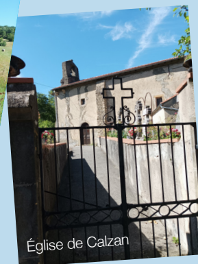
Église de Calzan