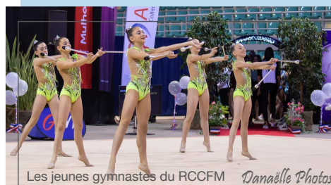
Les jeunes gymnastes du RCCFM