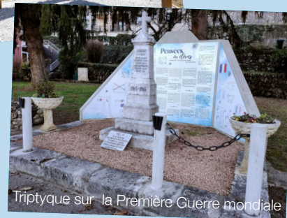
Triptyque sur la Première Guerre mondiale