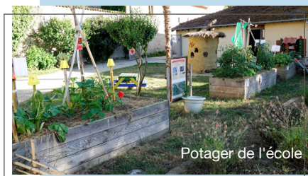
Potager de l'école