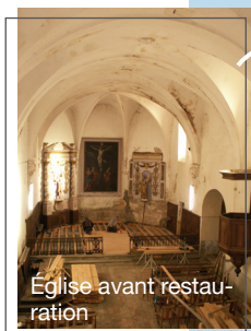
Église avant restauration

Témoin de ce passé, la Grotte de Dalou se cache au milieu des bois. Découvert fin 2015 lors de travaux d'ouverture d'un parcours de trail, ce lieu servait de relais à des personnes souhaitant passer la frontière ou s'engager dans le maquis. Ce n'est pas sans émotion qu'un ancien résistant qui y avait été hébergé a pu y revenir plus de 70 ans après.