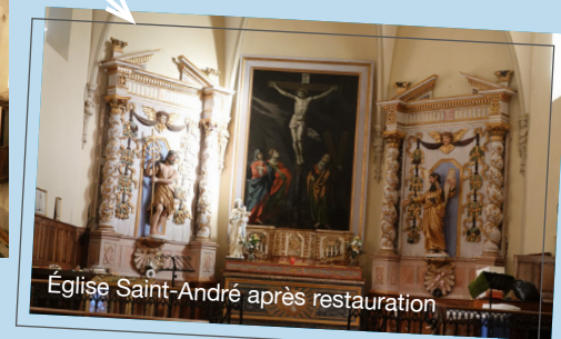
Église Saint-André après restauration