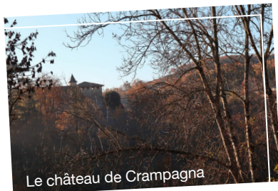
Le château de Crampagna

Le château de Crampagna est inscrit au titre des monuments historiques. Initié au XIII e siècle, l'édifice est aujourd'hui une propriété privée qui se visite, notamment lors des journées du patrimoine. Il offre un point de vue exceptionnel sur la vallée de l'Ariège.